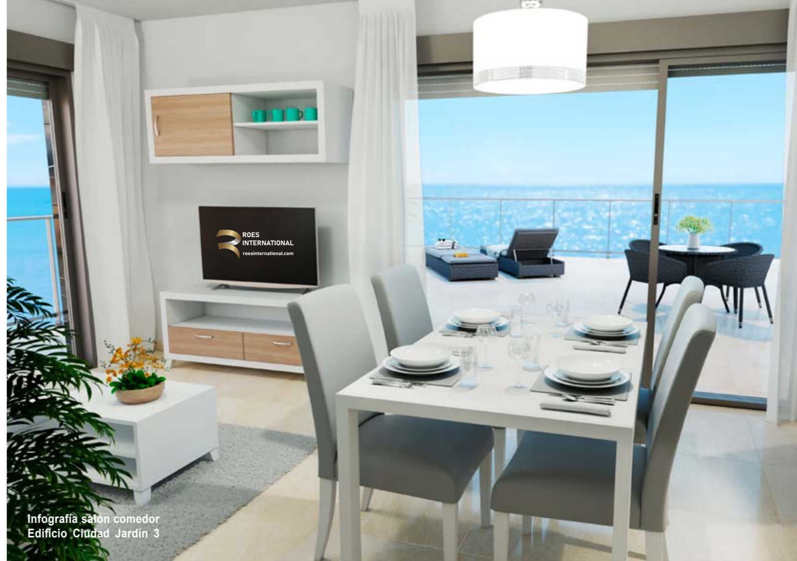
Infografía salón comedor Edificio Ciudad Jardín 3