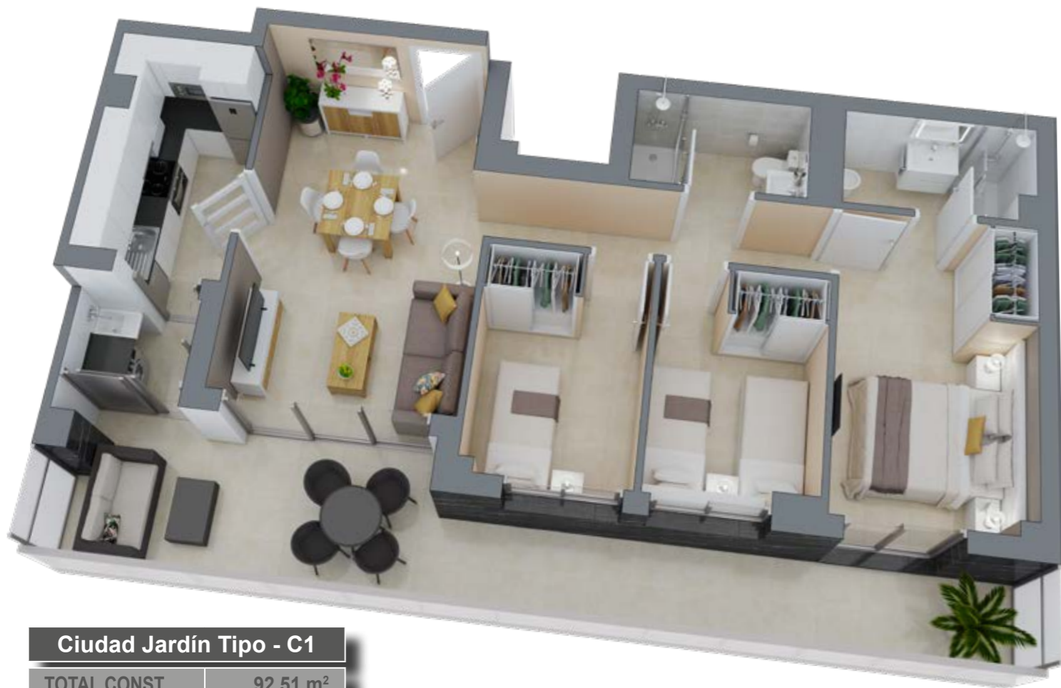
Ciudad Jardín Tipo - C1