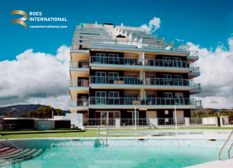
Fotografías de los exteriores del Edificio Ciudad Jardín I, junto al nuevo Edificio Ciudad Jardín 3