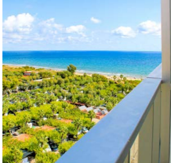
Fotografías tomadas en el Edificio Ciudad Jardín I, junto al Edificio Ciudad Jardín 3