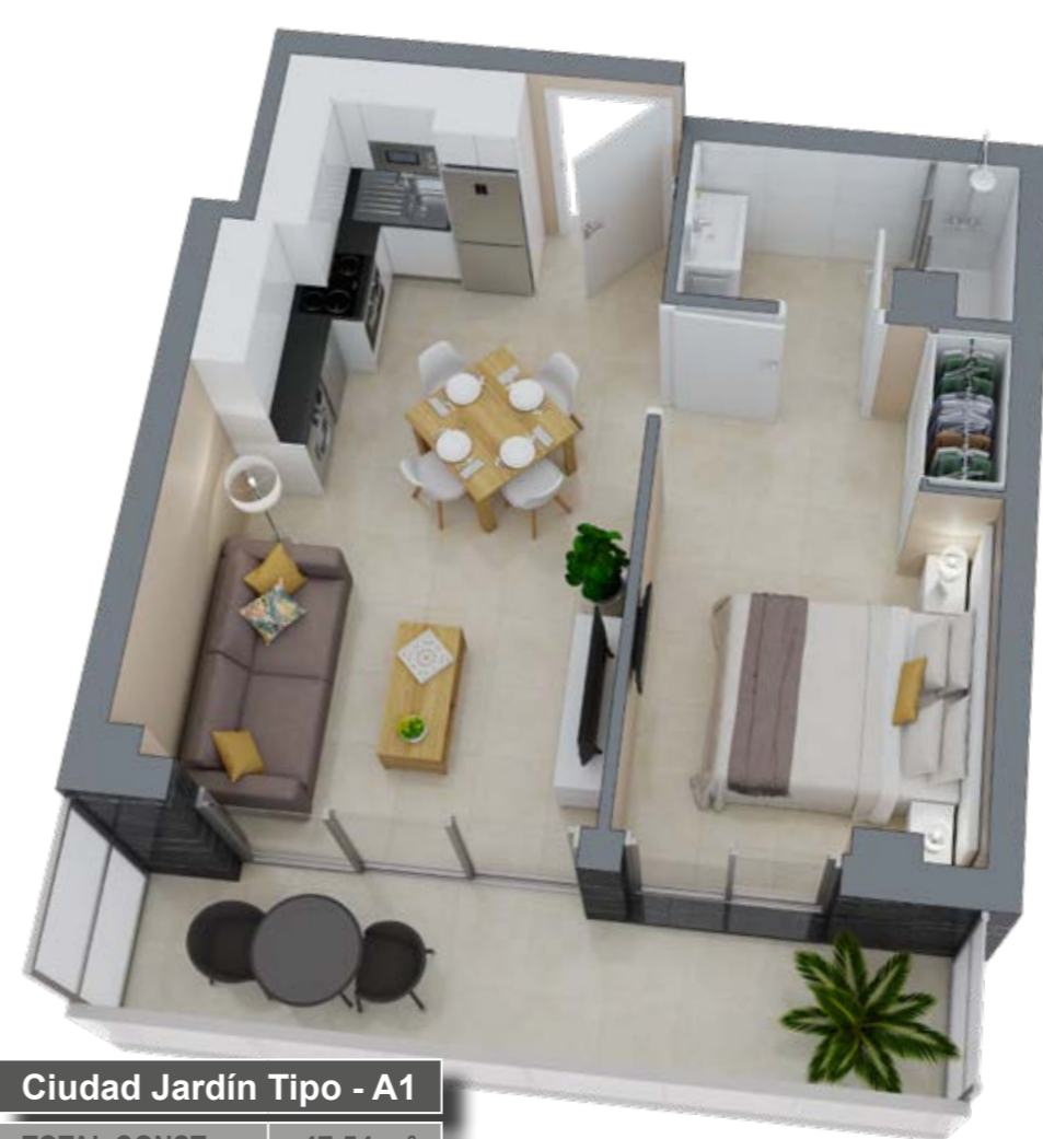
Ciudad Jardín Tipo - A1